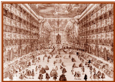
MILANO - IL TEATRO DUCALE sito in Palazzo Reale. Nel 1771 vi fu rappresentato l'Ascanio in Alba

MOZART A MILANO PRIMO E SECONDO VIAGGIO DIC. 1769 – DIC. 1771