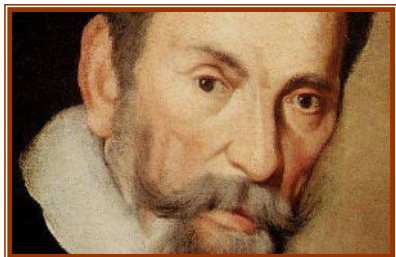
BERNARDO STROZZI, Ritratto di Claudio Monteverdi (1630 circa)

450° ANNIVERSARIO DELLA NASCITA di CLAUDIO MONTEVERDI